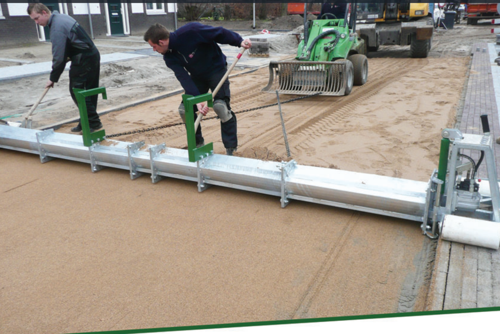
Voortrekken met kleinere shovel