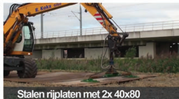
Stalen rijplaten met 2x 40x80