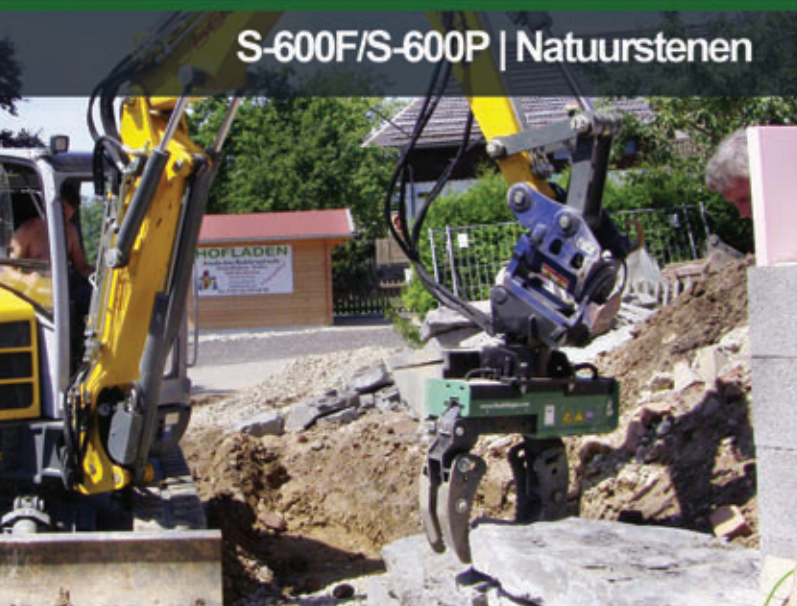
S-600F/S-600P | Natuurstenen