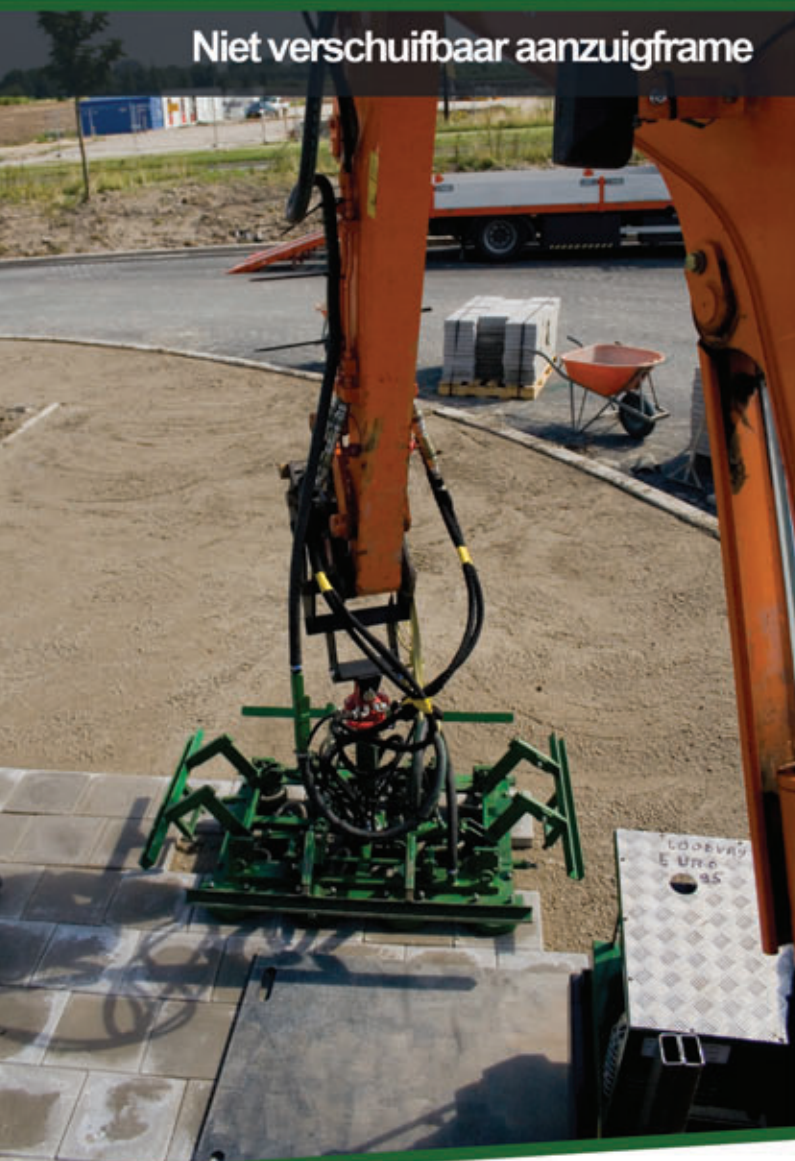
Niet verschuifbaar aanzuigframe