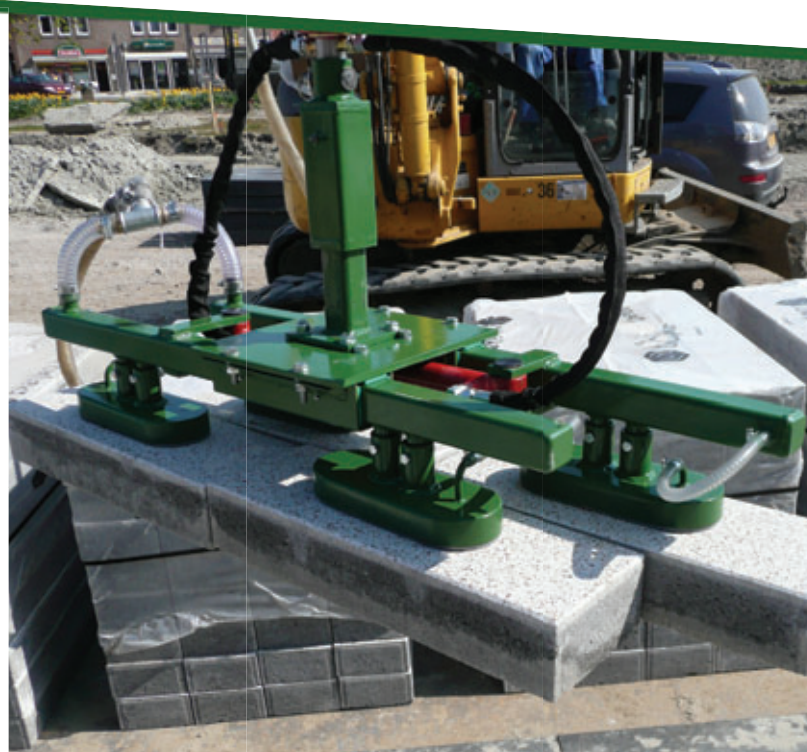
Hydr. frame voor 20 cm x 60 cm stenen