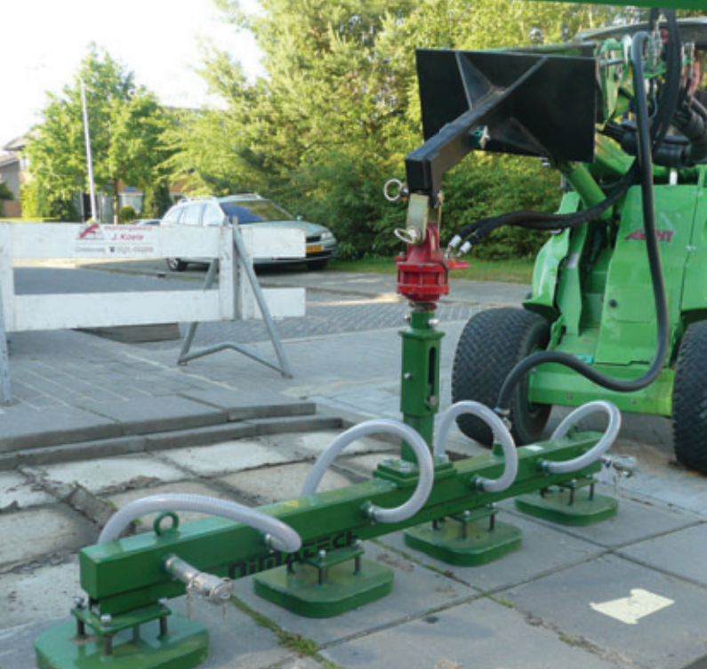
4x 28 cm x 28 cm