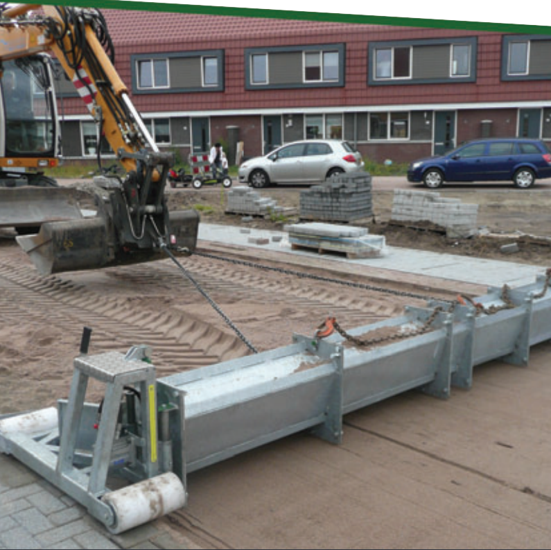
Voortrekken met kraan