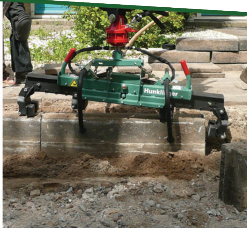
S-100 | Trottoirbanden