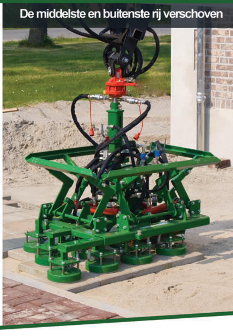
De middelste en buitenste rij verschoven