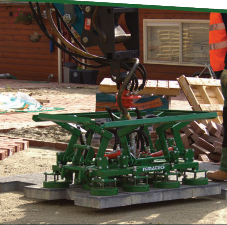
Hydraulisch verschuifbare middenrij