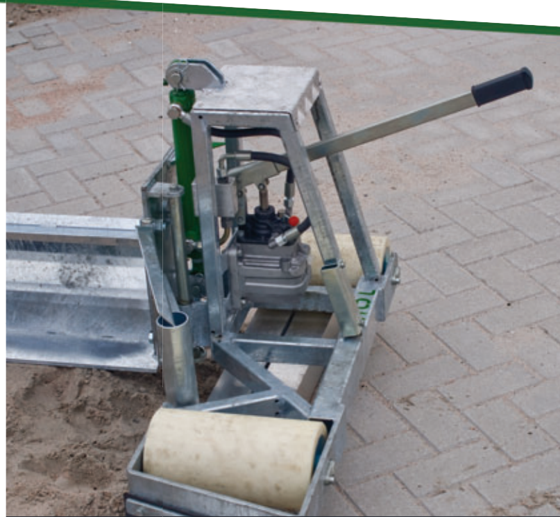
Hydraulische pomp voor hoogteverstelling