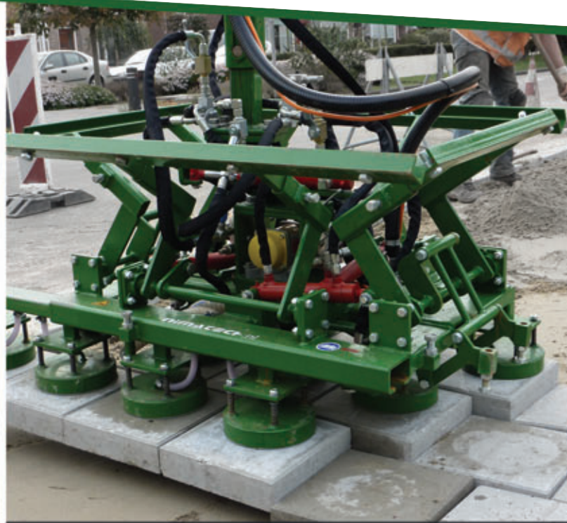
Hydraulisch verschuifbaar trapezium frame