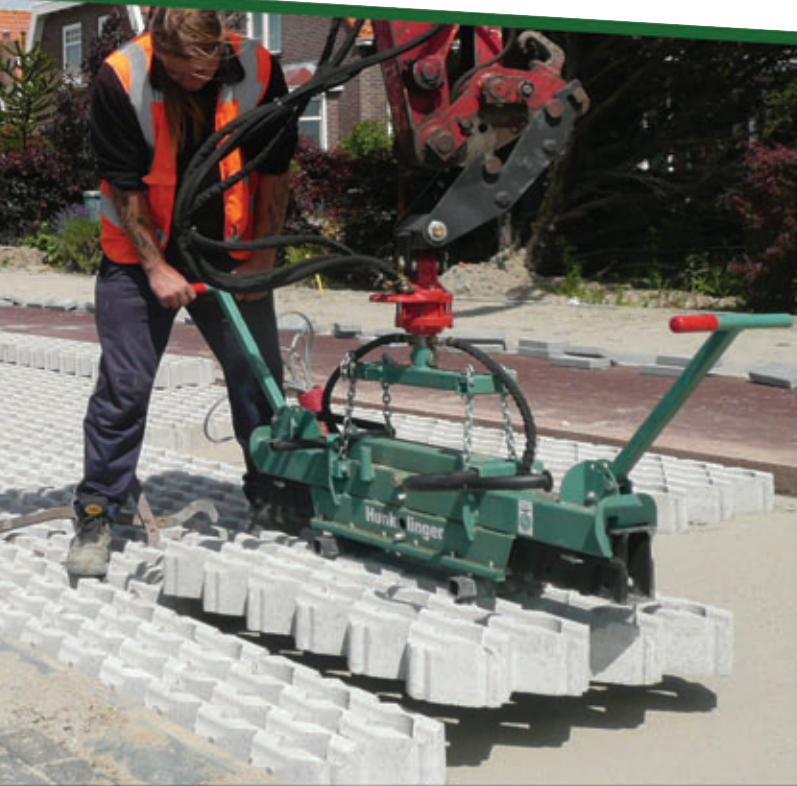
S-400 | Graskeien