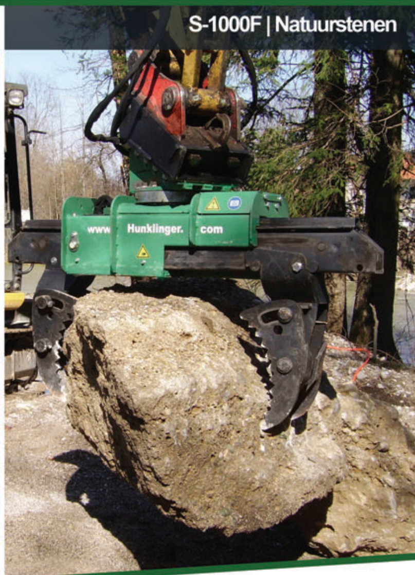
S-1000F | Natuurstenen