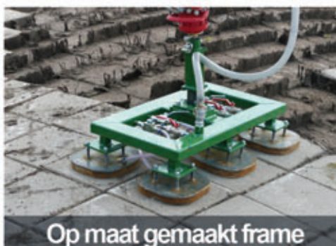
Op maat gemaakt frame