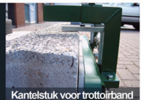
Kantelstuk voor trottoirband